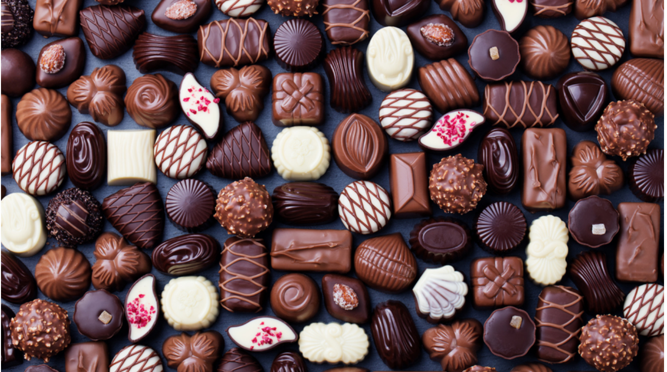
Imagen 1. El chocolate y el día de San Valentín tienen una larga y entrelazada historia.

El chocolate ha estado unido al romance desde hace tiempo. Durante cientos de años, se ha creído que el chocolate genera sentimientos de amor.